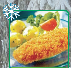
FILET RYBNY W CHRUPIAĄCEJ PANIERCE 6 kg

Produkty głęboko mrożone, wstępnie przygotowane. Szybki czas przyrządzenia.