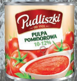
PULPA POMIDOROWA 2,5 kg

O cenę pytaj swojego Przedstawiciela Handlowego.