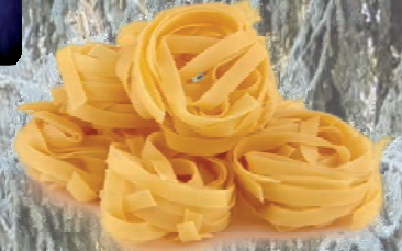
MAKARON TAGLIATELLE 3 kg