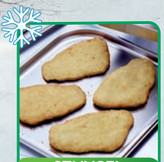
SZNYCEL ROŚLINNY 22 szt x 110 g - 2,5 kg