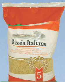
RYŻ PARABOLICZNY 5 kg