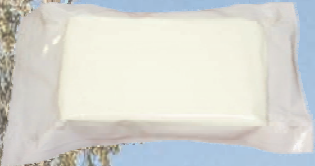
TWARÓG RACIBORSKI 2,5 kg