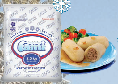
KARTACZE Z MIĘSEM 2,5kg