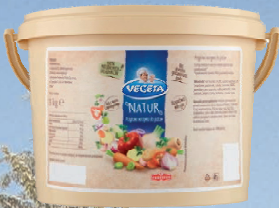
PRZYPRAWA VEGETA NATUR 3 kg