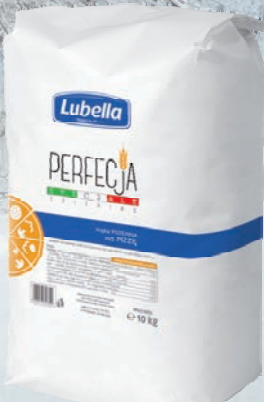
PERFEKJA MAKA NA PIZZĘ 10 kg