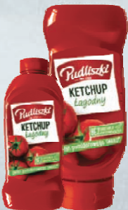
KETCHUP ŁAGODNY 480 g / 700 g