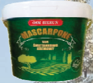
MASCARPONE 1 kg