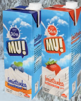
ŚMIETANKA 30%, 36% 1 L