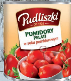
POMIDORY CAŁE „PELATI” 2,55 kg