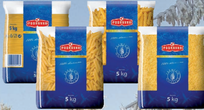
MAKARON ŚWIDEREK, NITKA, RURKA, SPAGHETTI 5 kg