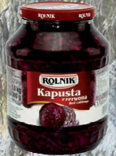
KAPUSTA CZERWONA 1700 ml