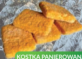
KOSTKA PANIEROWANA Z FILETA RYB BIAŁYCH 6 kg