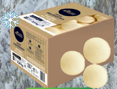
KLUSKI NA PARZE 66 szt - 2,6 kg