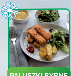
PALUSZKI RYBNE 900 g