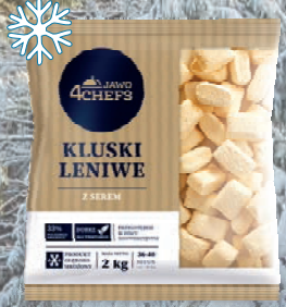
KLUSKI LENIWE 2kg