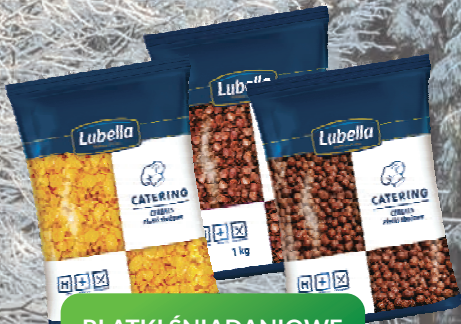
PŁATKI ŚNIADANIOWE 1 kg