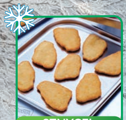
SZNYCEL ROŚLINNY 50 szt x 60 g - 3 kg