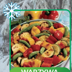
WARZYWA GRILLOWANE W STYLU ŚRÓDZIEMNOMORSKIM 1,5 kg