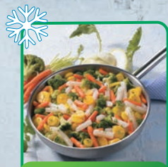
WARZYWA LETNI OGRÓD 1,5 kg