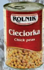
CIECIORKA 425 g