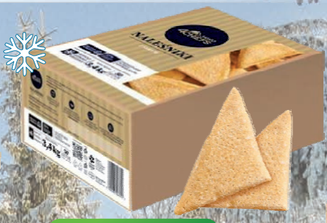
NALEŚNIKI Z SEREM 50 szt - 3,4 kg