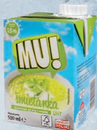
ŚMIETANKA 18% 500 ml