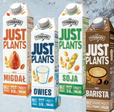
JUST PLANTS NAPÓJ OWIES, MIGDAŁ, SOJA, BARISTA 1 L