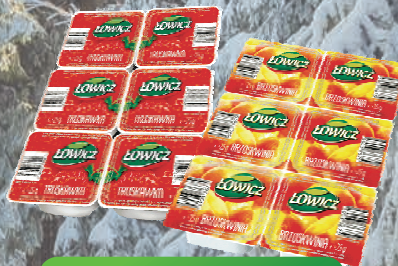
PRZYSMAK OWOCOWY TRUSKAWKA, BRZOSKWINIA 30 x 25 g