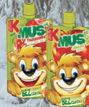
KUBUŚ MUS OWOCOWY 12 szt x 100 g