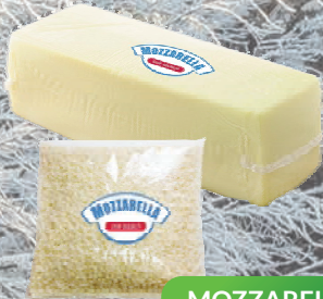
MOZZARELLA BLOK / WIÓRKI 1,5 kg / 2 kg