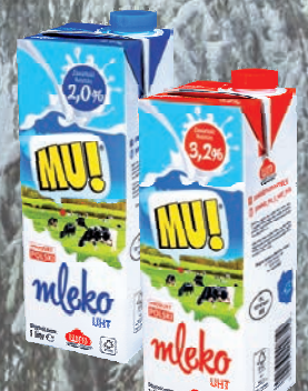
MLEKO 2% / 3,2% 1 L

O cenę pytaj swojego Przedstawiciela Handlowego.