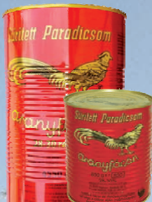
KONCENTRAT ZŁOTY BAŻANT 850 g / 4550 g