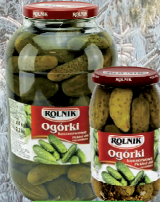
OGÓRKI KONSERWOWE 900 ml / 4250 ml