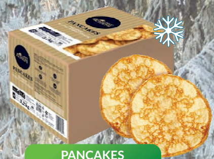
PANCAKES NALEŚNIKI AMERYKAŃSKIE 80 szt - 3,2 kg