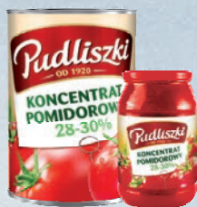
KONCENTRAT POMIDOROWY 195 g / 950 g