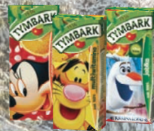
SOK 100% JABŁKO, POMARAŃCZA, MULTIWITAMINA 200 ml