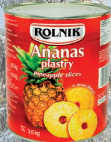
ANANAS PLASTRY 3100 ml