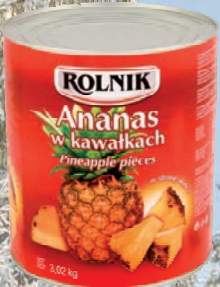
ANANAS KAWAŁKI 3100 ml