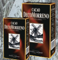
KAKAO 80 g / 150 g

O cenę pytaj swojego Przedstawiciela Handlowego.