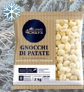
KLUSECZKI GNOCCHI 2kg