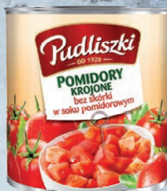
POMIDORY KROJONE 2,52 kg