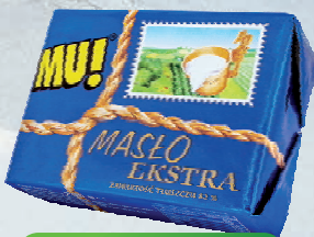
MASŁO EXTRA 82% 200 g