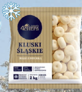
KLUSKI ŚLĄSKIE 2kg