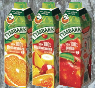
SOK 100% MULTIWITAMINA, JABŁKO, POMARAŃCZA 1 L