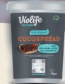
Violife Cocospread oryginalny kakaowy krem do smarowania 0,5 kg