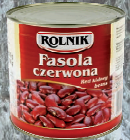
FASOLA CZERWONA 2650 ml