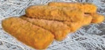
PALUSZKI RYBNE Z FILETA RYB BIAŁYCH 6 kg