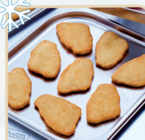
SZNYCEL ROŚLINNY 50 szt x 60 g - 3 kg