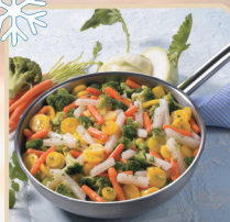
WARZYWA LETNI OGRÓD 1,5 kg