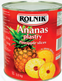
ANANAS PLASTRY 3100 ml