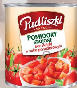
POMIDORY KROJONE 2,52 kg