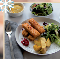
PALUSZKI RYBNE 900 g