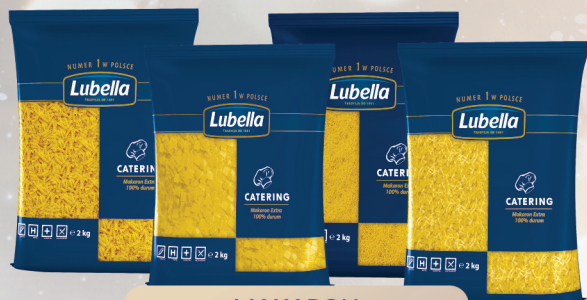
MAKARON ŚWIDERKI, KOKARDKI, NITKI, PIÓRA 2 kg