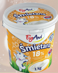
ŚMIETANA 18% 1 L