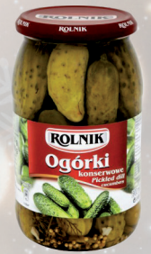
OGÓRKI KONSERWOWE 900 ml