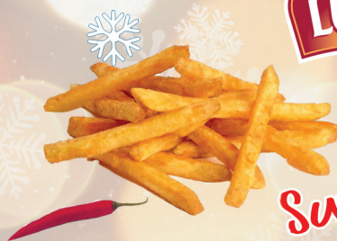
FRYTKI PROSTE W PRZYPRAWACH "SPICY" 2 kg