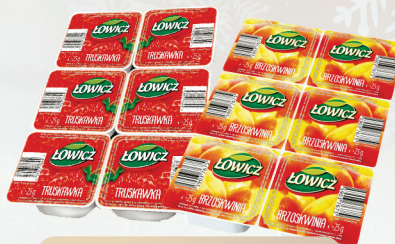
PRZYSMAK OWOCOWY TRUSKAWKA, BRZOSKWINIA 30 x 25 g