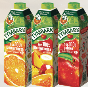
SOK 100% MULTIWITAMINA, JABŁKO, POMARAŃCZA 1 L