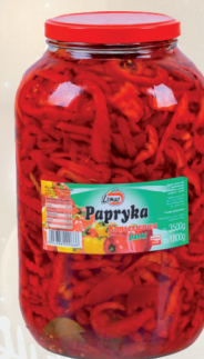
PAPRYKA CZERWONA PASKI 3,5 kg