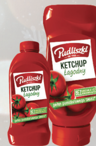
KETCHUP ŁAGODNY 480 g / 700 g