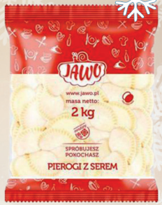
PIEROGI Z SEREM 2 kg