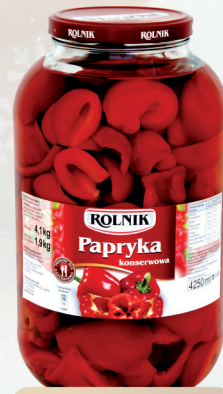
PAPRYKA CWIARTKI 4250 ml