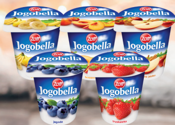
JOGURT JOGOBELLA MIX 150 g