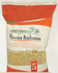
RYŻ PARABOLICZNY 5 kg