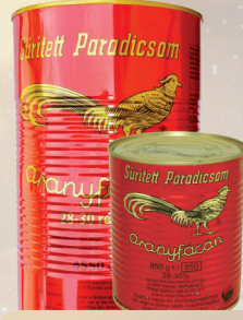
KONCENTRAT ŻŁOTY BAŻANT 850 g / 4550 g