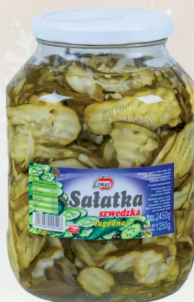
SALAŃKA SZWEDZKA 3,3 kg