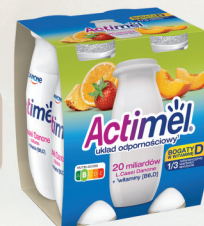
ACTIMEL MIX 4 x 100 g