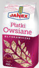
PŁATKI OWSIANE BŁYSKAWICZNE 400 g