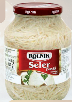
SELER PASKI 1700 ml