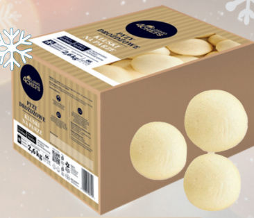
KLUSKI NA PARZE 66 szt - 2,6 kg