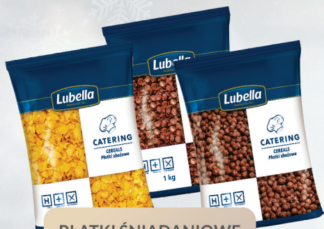
PŁATKI ŚNIADANIOWE 1 kg