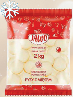
PYZY Z MIĘSEM 2 kg