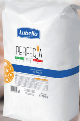
PERFEKJA MAKA NA PIZZĘ 10 kg