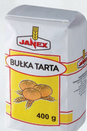
BUŁKA TARTA 400 g