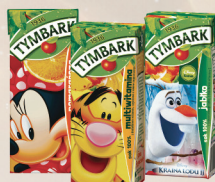
SOK 100% JABŁKO, POMARAŃCZA, MULTIWITAMINA 200 ml