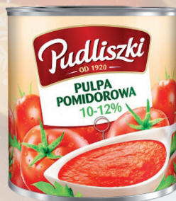
PULPA POMIDOROWA 2,5 kg