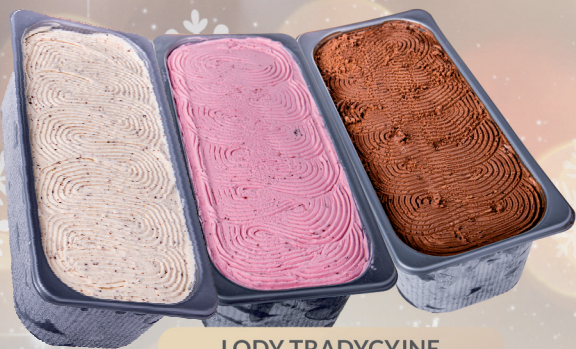
LODY TRADYCYJNE WANILIA, TRUSKAWKA, CZEKOLADA 4,5 L