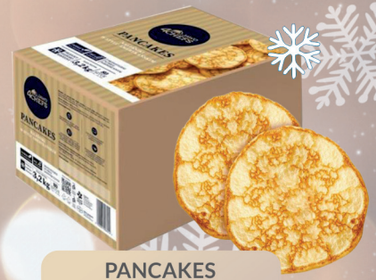
PANCAGES NALEŚNIKI AMERYKAŃSKIE 80 szt - 3,2 kg