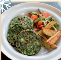
BURGER SZPINAKOWY 5 kg