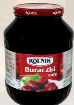
BURACZKI CAŁE 1700 ml