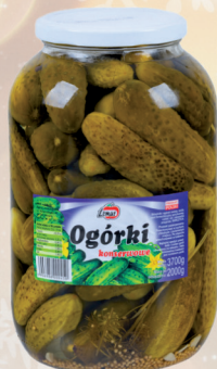
OGÓRKI KONSERWOWE 3,7 kg