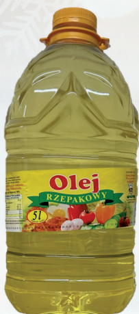
OLEJ RZEPAKOWY 5 L