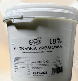
EMULSJA KULINARNA KREMOWA 5 L