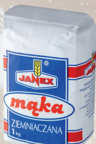
MĄKA ZIEMNIACZANA 1 kg