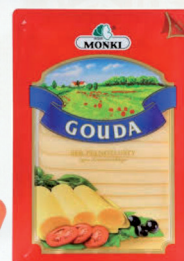
SER GOUDA PLASTRY 150 g