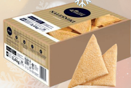
NALEŚNIKI Z SEREM 50 szt - 3,4 kg