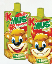
KUBUŚ MUS OWOCOWY 12 szt x 100 g