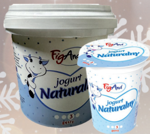
JOGURT NATURALNY 380 g / 1 L