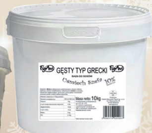
BAZA DO SOSÓW „TYP GRECKI” 5 L