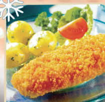
FILET RYBNY W CHRUPIAĄCEJ PANIERCE 6 kg