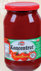
KONCENTRAT POMIDOROWY 900 g