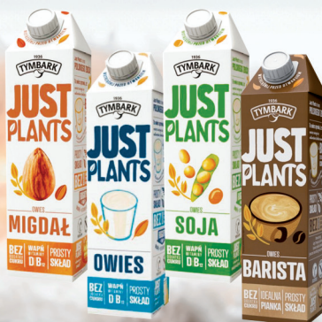
JUST PLANTS NAPÓJ OWIES, MIGDAŁ, SOJA, BARISTA 1 L