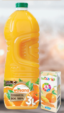
SOK POMARAŃCZOWY 200 ml / 3 L

O cenę pytaj swojego Przedstawiciela Handlowego.