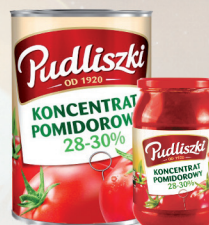
KONCENTRAT POMIDOROWY 195 g / 950 g