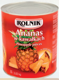
ANANAS KAWAŁKI 3100 ml