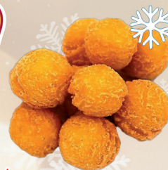
KULECZKI ZIEMNIACZANE 2,5 kg