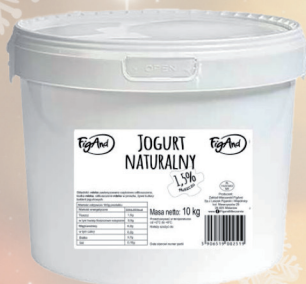
JOGURT NATURALNY 5 L