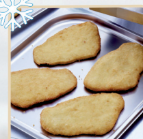
SZNYCEL ROŚLINNY 20 szt x 150 g - 3 kg