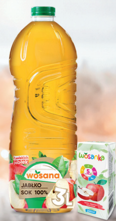
SOK JABŁKOWY 200 ml / 3 L