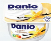
SEREK DANIO WANILIOWY 130 g