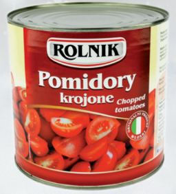
POMIDORY KROJONE 2650 ml