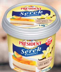
SEREK WANILIOWY 1 kg