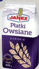
PŁATKI OWSIANE GÓRSKIE 400 g