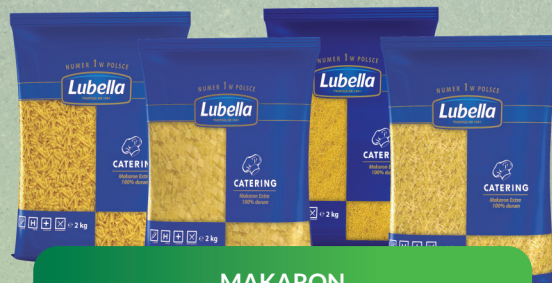
MAKARON ŚWIDERKI, KOKARDKI, NITKI, PIÓRA 2 kg