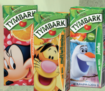
SOK 100% JABŁKO, POMARAŃCZA, MULTIWITAMINA 200 ml