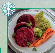
BURGER BURACZKOWY 5kg