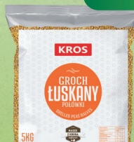
GROCH ŁUSKANY 5 kg