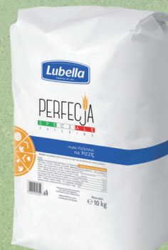
PERFEKJA MAKA NA PIZZĘ 10 kg