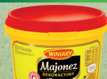
MAJONEZ DEKORACYJNY 3 kg