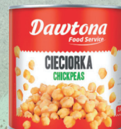
CIECIORKA 2650 g