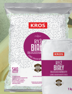
RYŻ BIAŁY 1 kg / 5 kg

© cenę pytaj swojego Przedstawiciela Handlowego.