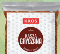
KASZA GRYCZANA 5 kg