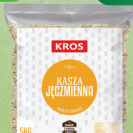
KASZA JĘCZMIENNA 5 kg