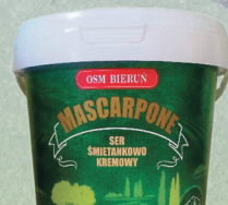
MASCARPONE 1 kg