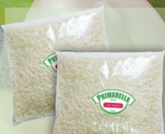
PRIMELLA GRANULAT 2 kg