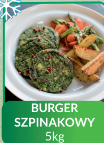
BURGER SZPINAKOWY 5kg