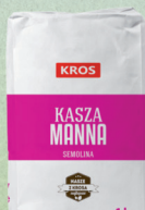
KASZA MANNA 1 kg