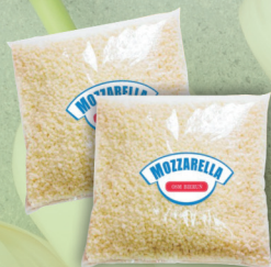
MOZZARELLA GRANULAT 2 kg