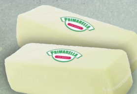
PRIMELLA BLOK 1,5 kg