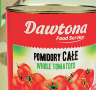
POMIDORY CAŁE 2,5 kg

O cenę pytaj swojego Przedstawiciela Handlowego.