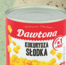
KUKURYDZA 400 g