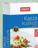
KASZA KUSKUS 300 g