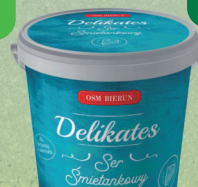
SER ŚMIETANKOWY DELIKATES 1 kg