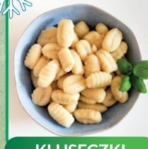
KLUSCZKI GNOCCHI 1 kg