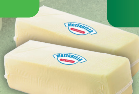
MOZZARELLA BLOK 1,5 kg