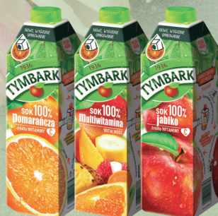
SOK 100% MULTIWITAMINA, JABŁKO, POMARAŃCZA 1l