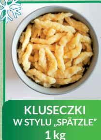
KLUSCZKI W STYLU „SPÄTZLE” 1 kg