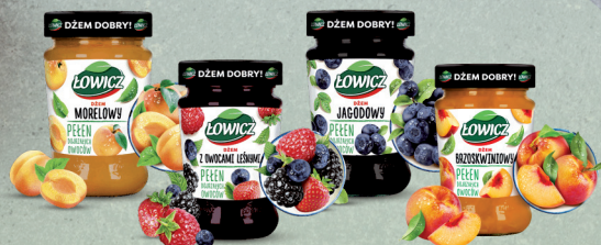
DŻEM NISKOŚLÓDZONY BRZOSKWINIA, MORELA, OWOCE LEŚNE, JAGODA 280 g