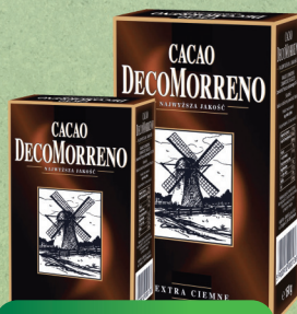
KAKAO 80 g / 150 g