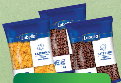
PŁATKI ŚNIADANIOWE 1kg