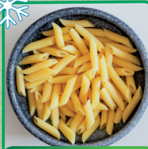
MAKARON PENNE 1 kg