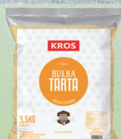
BUŁKA TARTA 3,5kg

KUP KARTON MAKARONU LUB KLUSCZEK A OTRZYMASZ CIASTO FRANCUSKIE 3KG GRATIS!