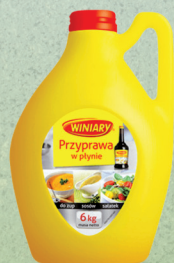
PRZYPRAWA W PŁYNIE 6 kg