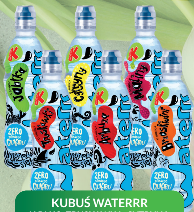
KUBUŚ WATERRR JABŁKO, TRUSKAWKA, CYTRYNA, ARBUŹ, MALINA, BRZOSKWINIA 0,5l