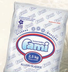
KLUSKI ŚLĄSKIE 2,5 kg