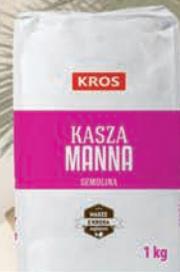
KASZA MANNA 1 kg