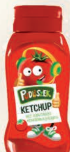
KETCHUP PUDLISZEK 275 g