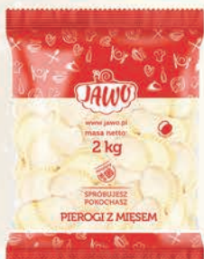
PIEROGI Z MIĘSEM 2 kg