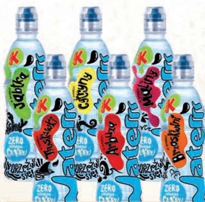
KUBUŚ WATERRR JABŁKO, TRUSKAWKA, CYTRYNA, ARBUZ, MALINA, BRZOSKWINIA 500 ml