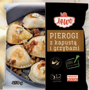
PIEROGI Z KAPUŚTĄ I GRZYBAMI 450 g

O cenę pytaj swojego Przedstawiciela Handlowego.