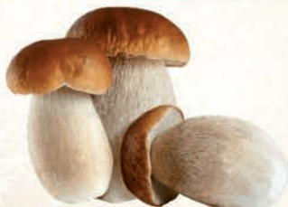
BOROWIK MROŻONY KOSTKA 2 kg