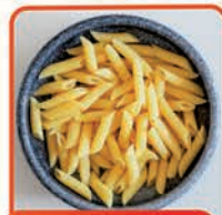
PENNE 1 kg