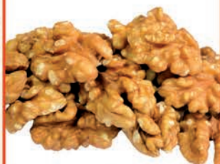
ORZECHY WŁOSKIE ŁUSKANE 1 kg