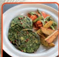
BURGER SZPINAKOWY 5 kg