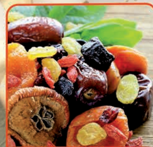
MIESZANKA KOMPOT / SUSZ 400 g