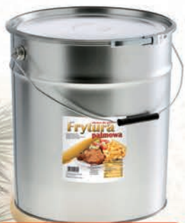
FRYTURA PALMOWA 20 L