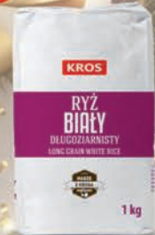
RYŻ 1 kg / 5 kg

O cenę pytaj swojego Przedstawiciela Handlowego.