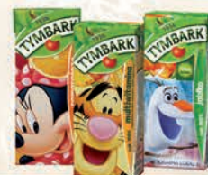
TYMBARK SOK 100% JABŁKO, POMARAŃCZA, MULTIWITAMINA 200 ml