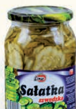
SALAŃKA SZWEDZKA 860 g