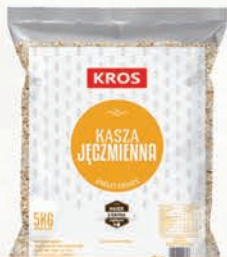
KASZA JĘCZMIENNA 5 kg