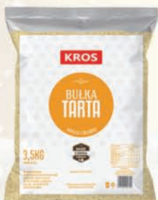
BULKA TARTA 3,5 kg