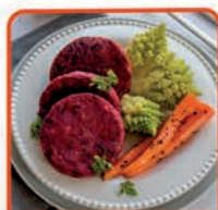
BURGER BURACZKOWY 5 kg