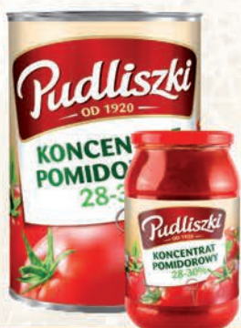
KONCENTRAT POMIDOROWY 195 g / 950 g