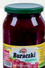
BURACZKI 860 g