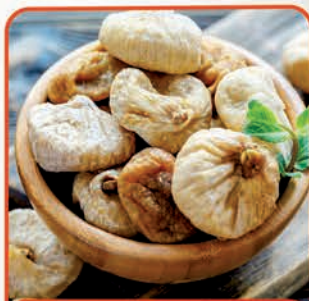
FIGI SUSZONE 1 kg