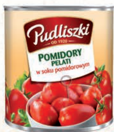
POMIDORY CAŁE PEŁNI 2550 g