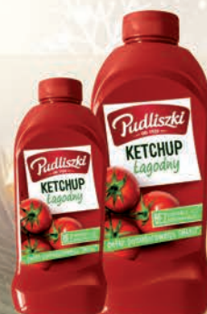
KETCHUP ŁAGODNY 480 g / 990 g