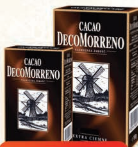
KAKAO 80 g/ 150 g