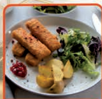
PALUSZKI RYBNE 900 g