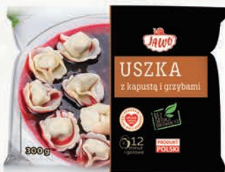
USZKA Z KAPUŚTĄ I GRZYBAMI 300 g