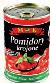
POMIDORY KROJONE 400 g