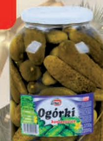
OGÓRKI KONSERWOWE 3700 g