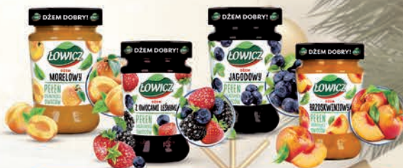
DŻEM NISKOSŁODZONY BRZOSKWINIA, MORELA, OWOCE LEŚNE, JAGODA 280 g