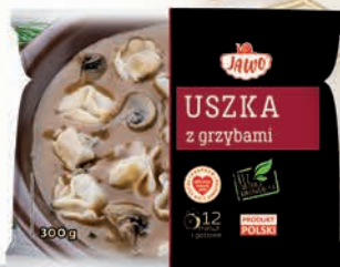
USZKA Z GRZYBAMI 300 g