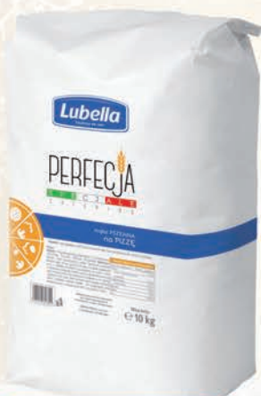
PERFECJA MAKA NA PIZZE 10 kg