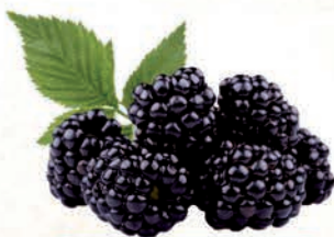
JEŻYNA MROŻONA 2 kg