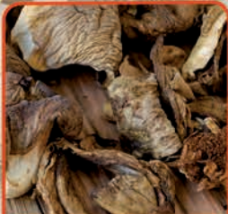
PODGRZYBEK SUSZONY KROJONY 1 kg