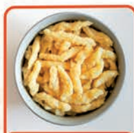
KLUSZECZKI W STYLU „SPÄTZLE” 1 kg