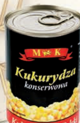
KUKURYDZA KONSERWOWA 400 g