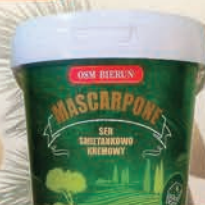
MASCARPONE 1 kg