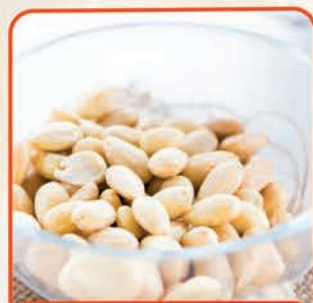
MIGDAŁY BLANSZOWANE 1 kg