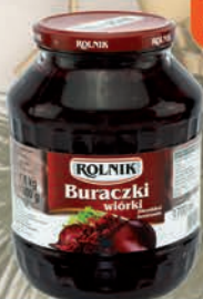
BURACZKI WIÓRKI 1700 ml