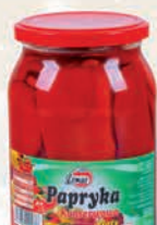
PAPRYKA KONSERWOWA 860 g