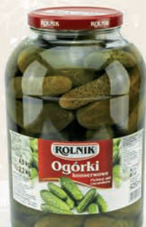
OGÓRKI KONSERWOWE 4250 ml