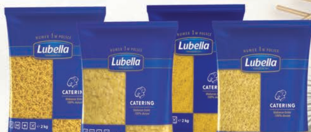
MAKARON ŚWIDERKI, KOKARDKI, NITKI, PIÓRA 2 kg