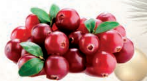
ŻURAWINA MROŻONA 2 kg