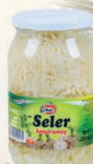
SELER KONSERWOWY 850 g