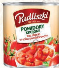
POMIDORY KROJONE 2520 g