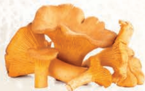
KURKA CAŁA MAŁA MROŻONA 2 kg