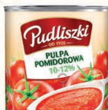
PULPA POMIDOROWA 2500 g