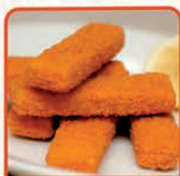
TICO MINTAJ PALUSZKI FILET 6 kg