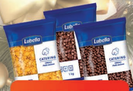
PŁATKI ŚNIADANIOWE 1 kg

O cenę pytaj swojego Przedstawiciela Handlowego.