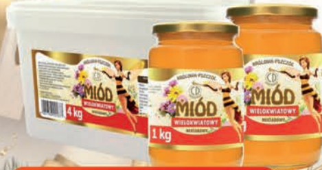
MIÓD WIELOKWIATOWY 1 kg / 1,4 kg / 4 kg