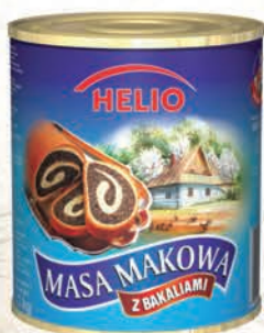
MASA MAKOWA HELIO 850 g