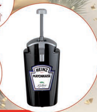
HEINZ SOM MAJONEZ, KETCHUP 2,5 l

O cenę pytaj swojego Przedstawiciela Handlowego.