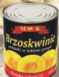
BRZOSKWINIE POŁÓWKI BEZ OTWIERACZA 820 g