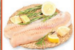
MINTAJ ALASKA FILET