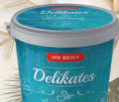
SER ŚMIETANKOWY DELIKATES 1 kg

O cenę pytaj swojego Przedstawiciela Handlowego.