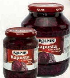
KAPUSTA CZERWONA 720 ml/ 1700 ml