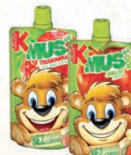
KUBUŚ MUS OWOCOWY 100 g