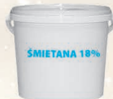
ŚMIETANA 18% 1 L