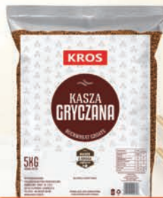
KASZA GRYCZANA 5 kg