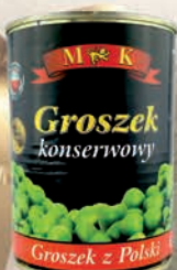
GROSZEK KONSERWOWY 400 g