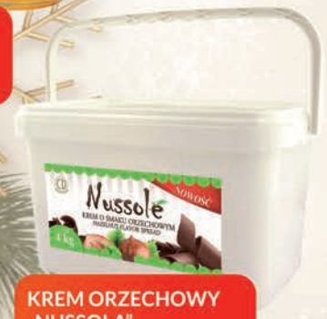
KREM ORZECHOWY "NUSSOLA" 4 kg