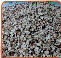
BOROWIK MROŻONY KOSTKA 2,5 kg