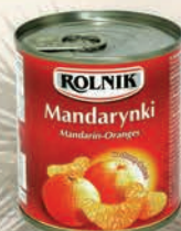
MANDARYNKI 314 ml