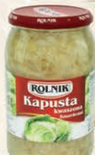
KAPUSTA KWASZONA 900 ml