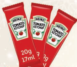
KETCHUP SASZETKI 100 x 17 ml