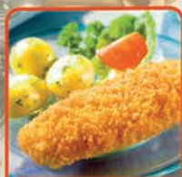
FILET RYBNY W CHRUPIĄCEJ PANIERCE 6 kg