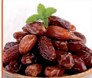
DAKTYLE SUSZONE 1 kg