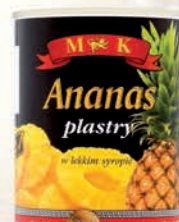
ANANAS PŁASTRY BEZ OTWIERACZA 565 ml