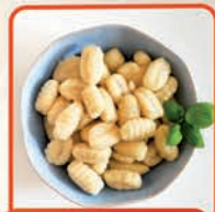
GNOCCHI 1 kg