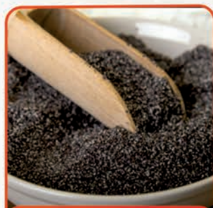
MAK MIELONY 500 g