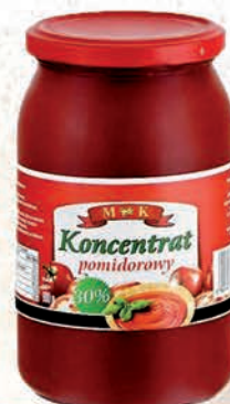
KONCENTRAT POMIDOROWY 30% 900 g