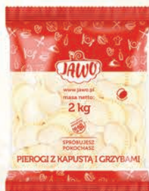
PIEROGI Z KAPUŚTĄ I GRZYBAMI 2 kg