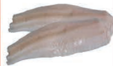
MIRUNA FILET BEZ SKÓRY