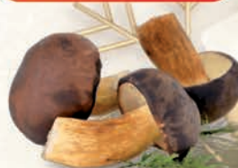
KOZAK MROŻONY KOSTKA 2 kg