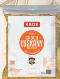
GROCH ŁUSKANY 5 kg