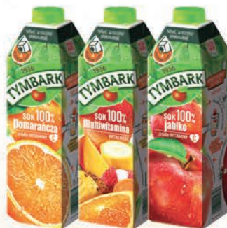
SOK 100% MULTIWITAMINA, JABŁKO, POMARAŃCZA 1 L