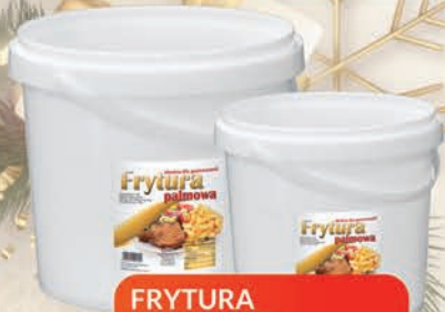
FRYTURA PALMOWA 10 L / 20 L